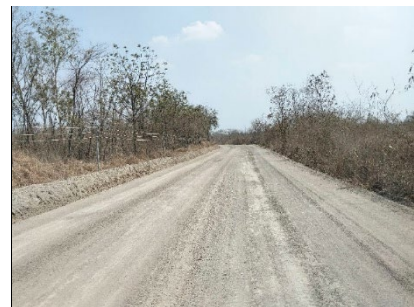
ทางเข้า-ออก พื้นที่โครงการ