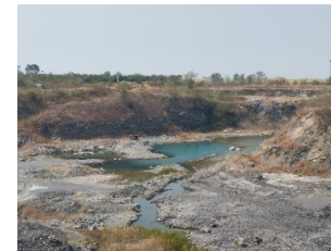
บ่อขุมเหมืองเก่า