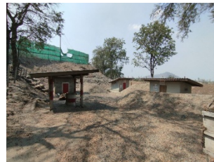
สถานที่เก็บวัตถุระเบิด