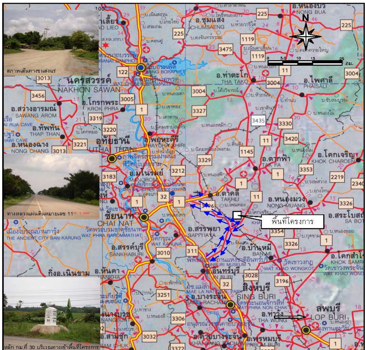
รูปที่ 1-3 แสดงการคมนาคมเข้าสู่พื้นที่โครงการ