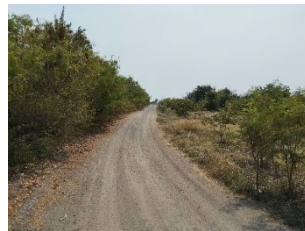
พื้นที่เว้นการทำเหมือง