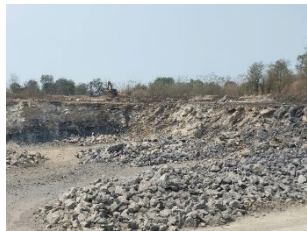
พื้นที่หน้าเหมืองปัจจุบัน