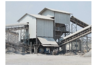
โรงโมหินของโครงการ